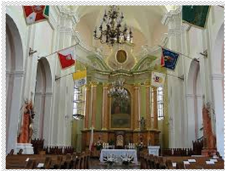
Prezbiterium Katedry Trójcy Przenajświętszej w Drohiczynie