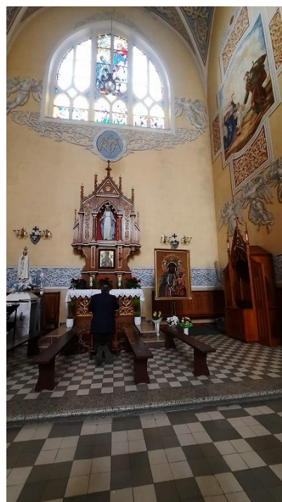
Kościół p.w. św. Stanisława Błm - Myszków