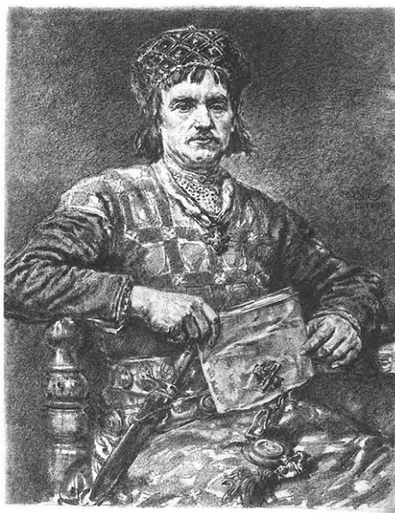
Bolesław V Wstydlivy (Cnotliwy, Roztropny)